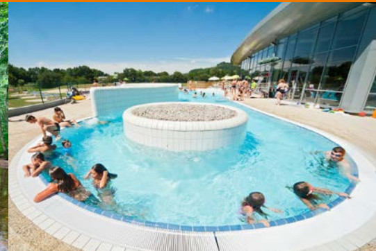
Centre Aquatique du Bassin d'Aurillac District swimming-pool