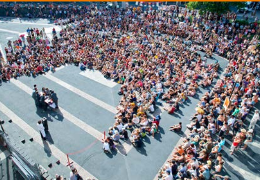
Festival International de Théâtre de Rue d'Aurillac Aurillac's International Street Festival