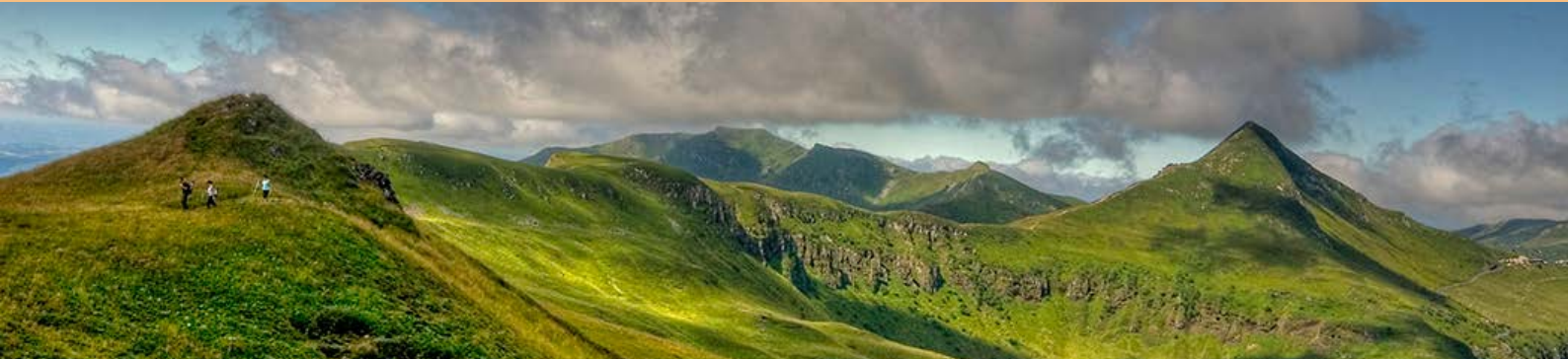
Grand Site du Puy Mary Grand Site of the Puy Mary