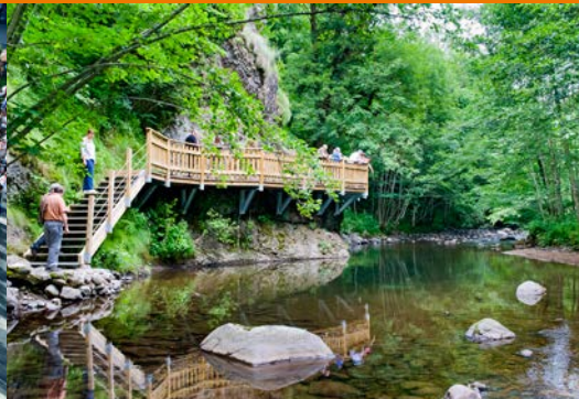
Gorges de la Jordanne Gorges of the Jordanne